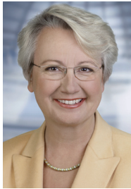
Grüßwort Annette Schavan

Die Bildungsrepublik ist auf gutem Weg. Doch um Deutschland zur Bildungsrepublik zu machen, braucht es mehr als den Staat und die Schule. Wir brauchen eine breite gesellschaftliche Bewegung.